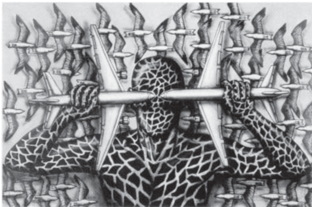
Målning av den kubanske konstnären Pepe Franco

Några dagar innan mordet planerade Kennedy ett möte med höga tjänstemän från Kuba för att förhandla om normalisering av relationerna, enligt ett nyligen offentliggjort, tidigare hemligstämplat band. Mordet blev ett bakslag för Fidel Castro. Han försökte att starta en ny dialog, men Lyndon Johnson var inte intresserad. Ett senare försök av Carter att återupprätta normala relationer i slutet av 70-talet stoppades av yttersta högern. Sedan dess har varje försök att bryta blockaden slagits tillbaka av kubanska exilgrupper, som utövar ett onaturligt stort politiskt inflytande.