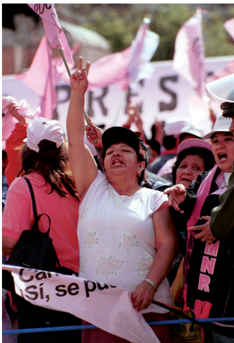
Kvinnor demonstrerar i Bolivia.

En innovativ och fartfylld föreställning kring historia och aktuella rörelser i Latinamerika till-