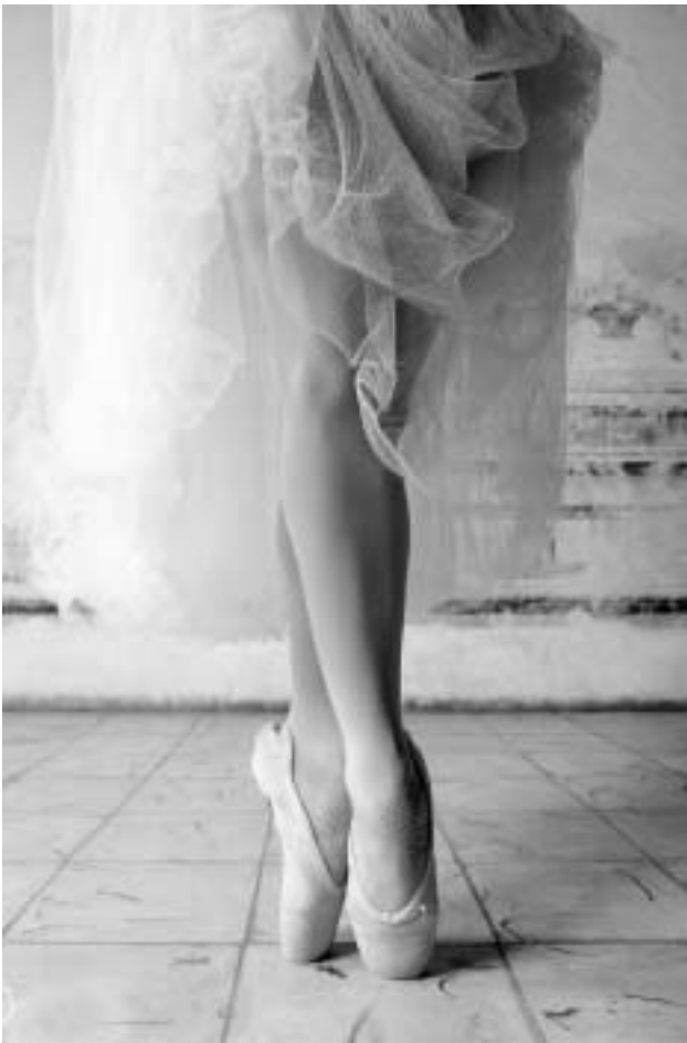
HABANEROS - PRIMA BEN HABANEROS - ADELEIDA OCH WILKI