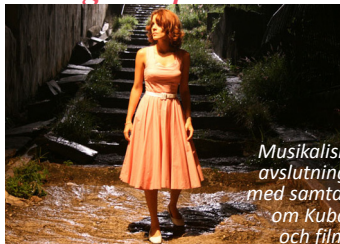
Musikalisk avslutning med samtal om Kuba och film