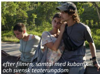
efter filmen, samtal med kubansk och svensk teaterungdom