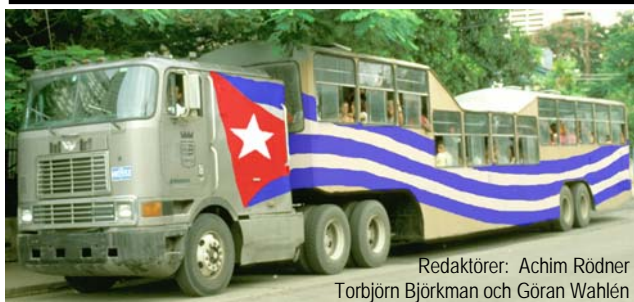
Redaktörer: Achim Rödner Torbjörn Björkman och Göran Wahlén