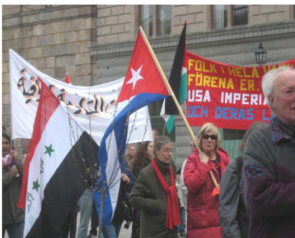
Även på Röd Front syntes Kubas flagga.