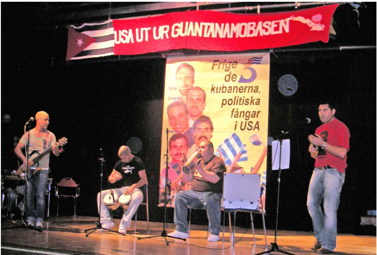
Heta latinamerikanska rytmer med Sangre Morena.