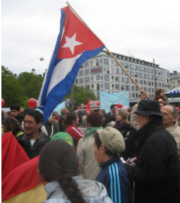
Kubafanan vajar stolt vid Medborgarplatsen och VP:s samling.

Årets 1 majdemonstrationer fokuserade på motstånd mot den förda högerpolitiken och guldregnet till dem som redan har det bra. Temat passade in perfekt på våra flygblad om Kuba, som med praktiska exempel visar att det går att fördela välstånd så att alla får tillgång till den.