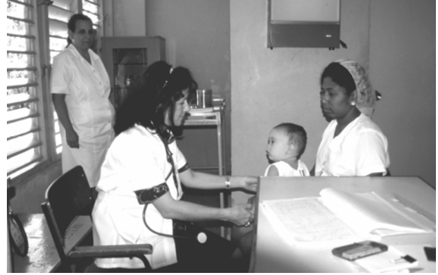
Läkarmottagning på ett kubanskt daghem. Kuba har högsta läkartätheten i hela världen, 30.000 av dem är familjeläkare eller arbetar på skolor och daghem som på bilden.