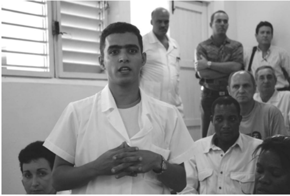
Läkarstudenten på bilden är från Västsahara. Han är en av 12.000 ungdomar från fattiga länder som får gratis läkarutbildning på Kuba i dag.