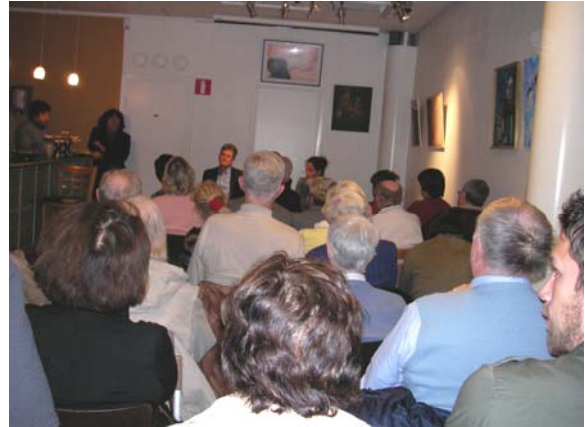
Fullsatt, med publik ut till gatan som ville höra mera om Kuba.