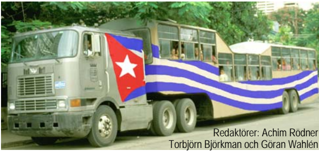
Redaktörer: Achim Rödner Torbjörn Björkman och Göran Wahlén