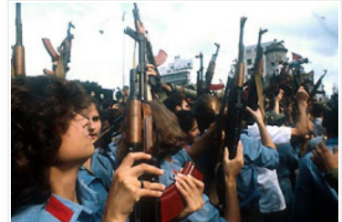
STUDENTER UR FOLKMLISEN