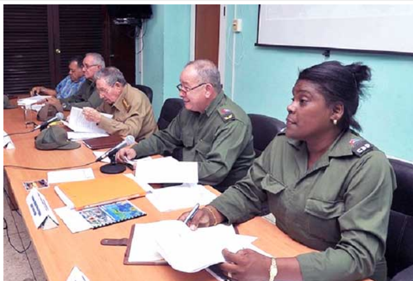
Provinskommittén för det Nationella Civilförsvaret i Santiago de Cuba i arbete under orkanens framfart med besök av president Raul Castro.