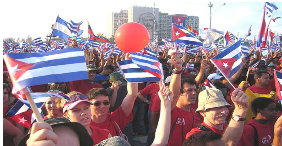
1 maj i Havanna 2006 med flera svenska deltagare

Fira 1 maj på Revolutionstorget i Havanna! Två veckor med fullspäckat program tillsammans med Kubavänner från hela världen. Pris: ca 12.500 kr (inkl. flygresa, kost, logi, transporter, rundresa, kulturprogram, studiebesök etc).